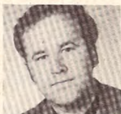
10. Piet Jacobs Peperstraat 56