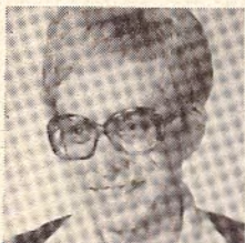
1. Greet Ermen Gemullehoeken- weg 25b