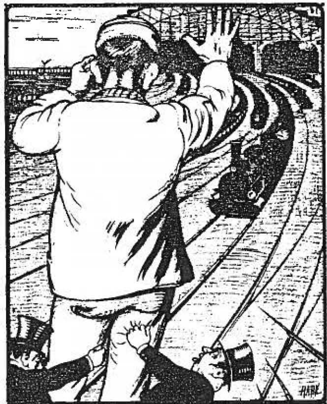
Gansch het raderwerk staat stil Als Uw machtige arm het wil...

dag uit de trein drukwerken op het perron van Oisterwijk waren geworpen, die door het personeel in beslag waren genomen. De burgemeester verzocht om een exemplaar van de manifesten. De stationschef schreef onmiddellijk terug. Wegens ongesteldheid was hij die dag slechts enkele ogenblikken op het station. "Ik vernam daar van het bureau-personeel dat er door reizigers manifesten waren geworpen uit den trein van 6.43 aan de achterzijde; ik heb deze echter onmiddellijk in mijne aanwezigheid doen verbranden; tot mijn spijt kan ik U geen exemplaar daarvan toezenden. Mochten er meer dergelijke papieren komen, en ik zie dit, dan zal ik ... U een exemplaar doen toekomen, en het spreekt vanzelf, dat door mij de verspreiding wordt tegengegaan ". De loyaliteit van chef Adriaansen was ontegensprekelijk aanwezig maar zijn eigen initiatief, het verbranden van de manifesten, zal door de overheid niet gewaardeerd zijn. Waarschijnlijk sproot deze handeling echter voort uit loyaliteit met de clerus die voortdurend opriep onwelgevallige lectuur terstond te vernietigen.